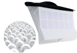
Patronen mit 3D-Netzgewebe hoher Rückhaltegrad